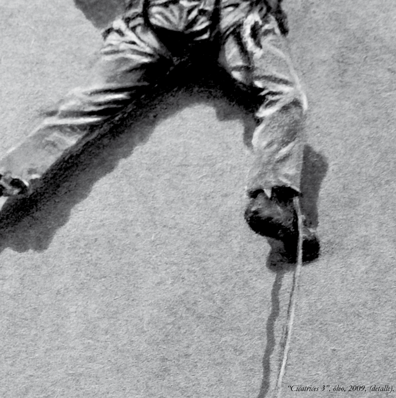
"Cicatrices 3", óleo, 2009, (detalle).

posiblemente al no ser consciente de la importancia de ese devenir en su pintura le era muy difícil explicar su posición artística. Es claro que en muchas ocasiones esto le generaba a Pollock conflictos, la sospecha de que no lo tomaran en serio, para cuando permitió que lo grabaran en vivo, hubo algunos hechos de conflicto que relatan las personas que asistieron a esta filmación. Pero este hecho lo que evidencia es precisamente que un pintor que pasa por este proceso debe estar preparado para no explicar nada de lo que pueda ocurrir en esos momentos, el proceso del devenir viene atado al cuerpo sin órganos, ellos acontecen simplemente.