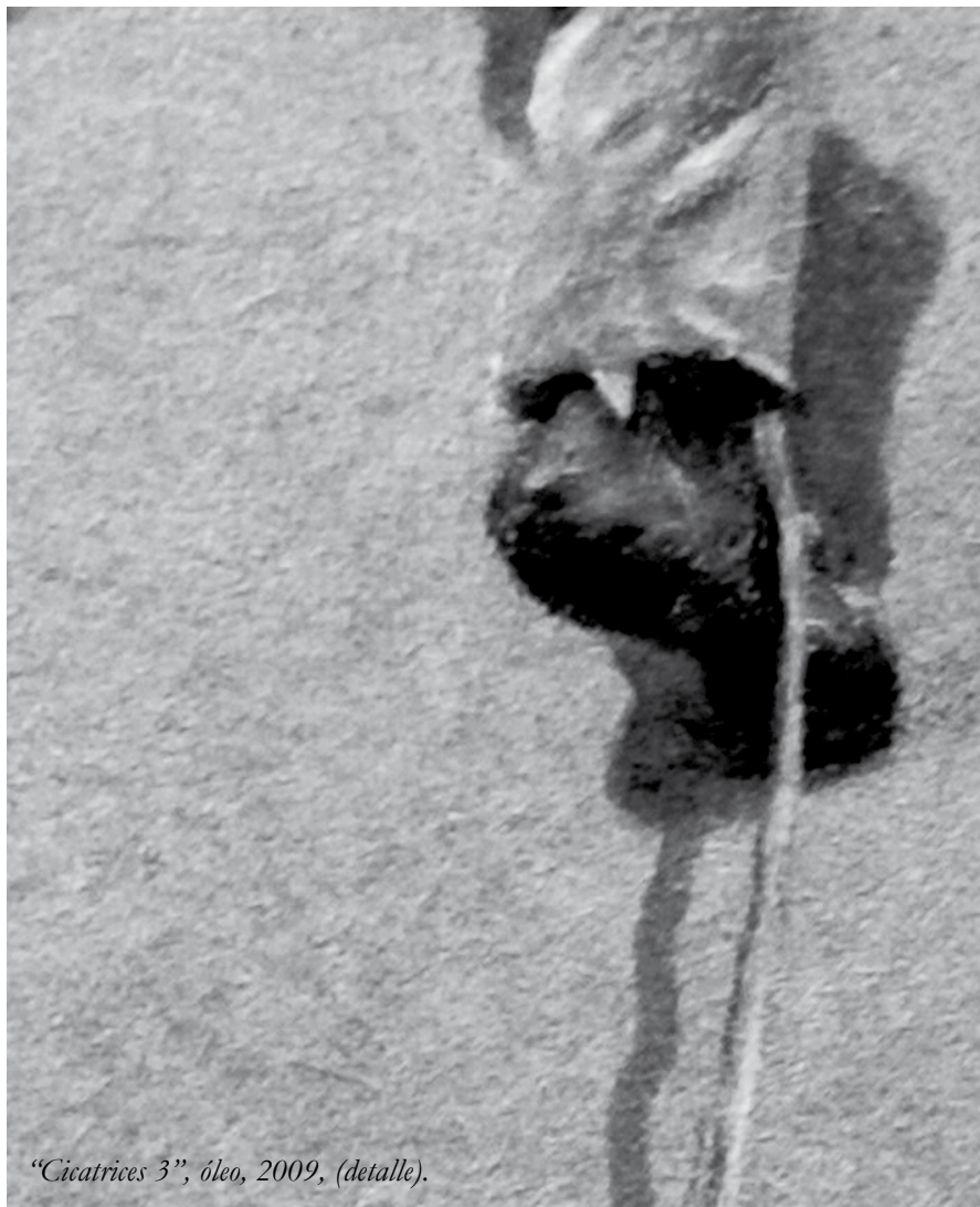
“Cicatrices 3”, óleo, 2009, (detalle).