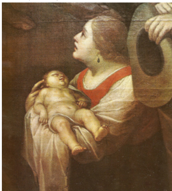
Figura 3. La predicación de San Francisco Javier (detalle)

Nota. Iglesia de San Ignacio, Bogotá, 1698. Posible rostro de la hija de Vásquez.