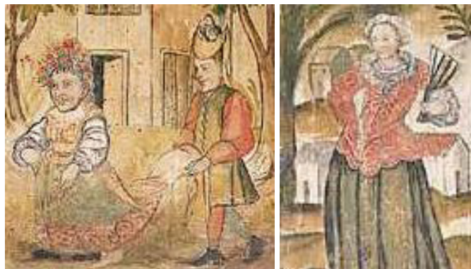
Figura 5. Biombo santafereño (detalles)

El cuidado en la representación de detalles como la corona de flores de la mujer de la izquierda o los encajes de la camisa y los pliegues en la falda de la mujer de la derecha hacen patente una intención de reproducir de manera creíble las cosas representadas. Por otro lado, las distorsiones, visibles en estos dos detalles (proporción de los cuerpos y perspectiva de los edificios), son indicios de que quien realizó las imágenes no tenía ante sí modelos de construcción (bocetos del natural o esquemas previos) o la pericia técnica para construirlos.