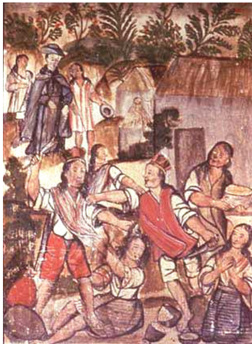
Figura 6. Biombo santafereño (detalles)

Por último, siendo mujer, abandonada por su amante y expulsada del hogar por su padre (y en un contexto patriarcal y puritano como el de la Colonia), la visión artística de Feliciano debió ser solidaria y sensible a la existencia de otros sujetos subalternos, como campesinos, mestizos e indígenas. Sería viable asumir que en una serie de imágenes de interés doméstico como las del biombo, pintadas por una mujer en tales condiciones de exclusión, su representación sea índice de simpatía o identificación.