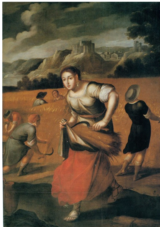
Figura 2. Ruth segadora

Nota. Iglesia de Santo Domingo.