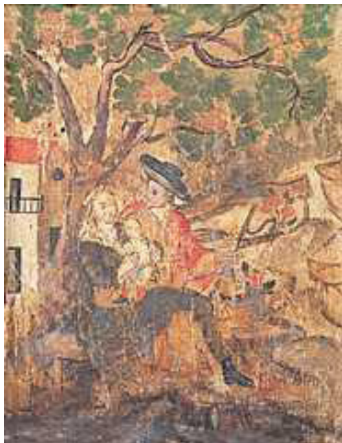
Figura 7. Biombo santaferño (detalle)