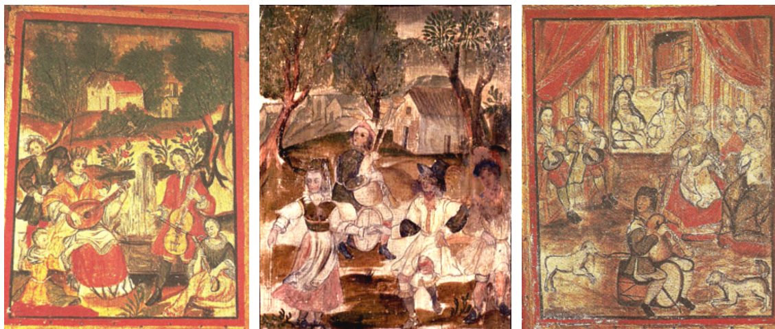
Figura 4. Biombo santafereño (detalles)